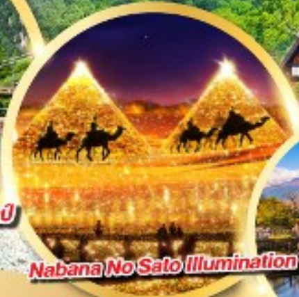
Nabana No Sato Illumination