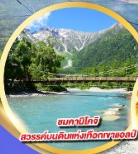
ชมคาบิโกจิ

นั่งกระเช้าลอยฟ้า 2 ชั้น ชินโฮทากะ หนึ่งเดียวในญี่ปุ่น แลนด์มาร์กยอดฮิตของโอคุซิดะ