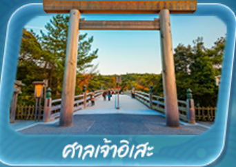
ศาลเจ้าอิสะ

12 - 17 พ.ค. 69 / 19 - 24 พ.ค. 69 26 - 31 พ.ค. 69 / 2 - 7 มิ.ย. 69 9 - 14 มิ.ย. 69