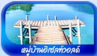
หมู่บ้านอิเซลทออลด์