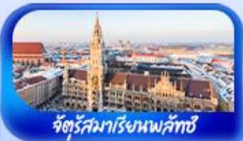
จัตุรัสมาเรียพลาทซ์