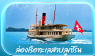
คองเรือทะเลสาบลูเซิร์น

ซูริก โลซาน เวเวย์ เซอร์แมท ลูเซิร์น ริกิ