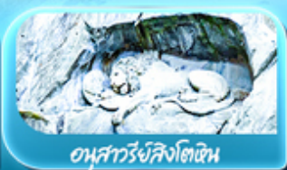
อนุสาวรีย์สิงโตหิน