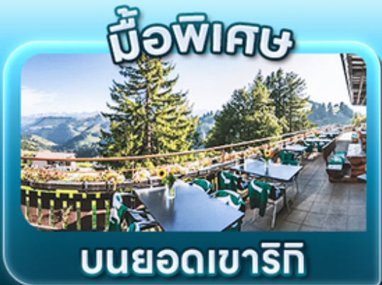
บิวฟิตซ์