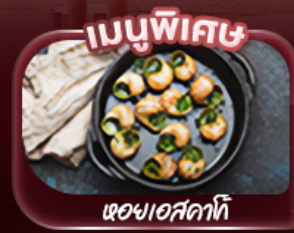
ผอขอสาคาท์