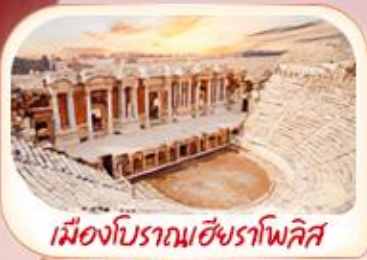
เมืองโบราณเฮียราโพลิส