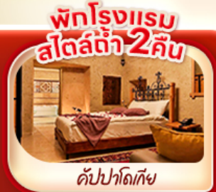
พักโรงแรม สโตร์ท่า 2 คืน