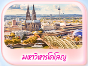
มทาวินทาร์โคโลญ