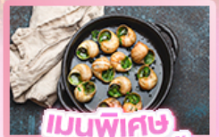
เมนูพิเศษ หอยเอสคาโท

เยอรมัน เนเธอร์แลนด์ เบลเยียม ฝรั่งเศส Keukenhof