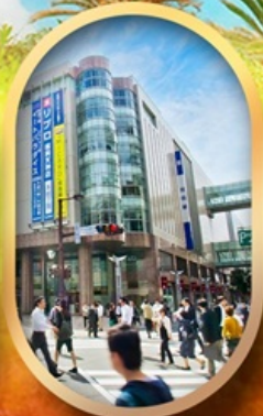
ช้อปปิ้งย่านกินจิน