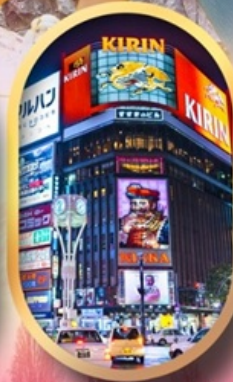
ช้อปปิ้งย่านซูซุกิโนะ