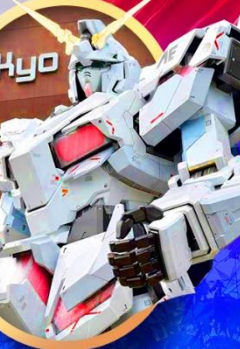
ห้างไอโดปะกันดั้ม