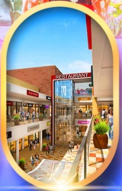
มิตซุยเอะอิค้ำเกิ้ลิต