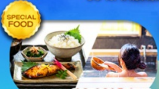
อาหาร JAPAN SET แชนนอนแบบญี่ปุ่น