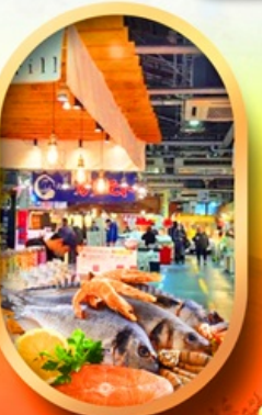
ตลาดปลาฮงโศ