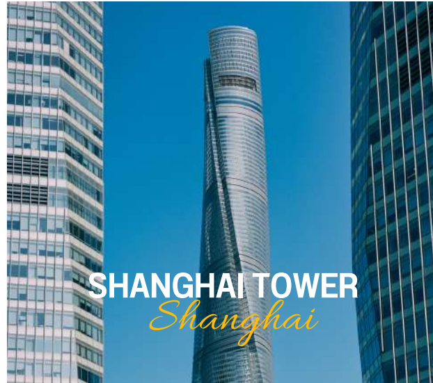
SHANGHAI TOWER Shanghai

เป็นหนึ่งในตึกระฟ้าที่ยิ่งใหญ่ที่สุดในโลกและเป็นสัญลักษณ์ของการพัฒนาและความเจริญก้าวหน้าของเมืองเซี่ยงไฮ้ในช่วงทศวรรษที่ผ่านมาตึกนี้ไม่เพียงแต่มีความสูงที่น่าประทับใจแต่ยังเป็นสัญลักษณ์ของความทันสมัยและนวัตกรรมในด้านสถาปัตยกรรมและวิศวกรรมความสูงเซี่ยงไฮ้ทาวเวอร์มีความสูง63เมตรตึกที่สูงที่สุดในจีน และ อันดับที่ 2 ของโลก รองจาก เบิร์จคาลิฟา ที่ดูไบ ตึกนี้มี 128 ชั้น โดยมี 5 ชั้นใต้ดิน และการออกแบบที่มีการลดขนาดตัวอาคารจากฐานขึ้นไปยังชั้นบนทำให้รูปร่างของตึกดูเหมือน"ขวดลด"หรือ "เกลียว"ซึ่งช่วยให้ตึกมีความมั่นคงและสามารถต้านทานลมแรงได้ดี กระจกโปร่งแสงและเหล็กกล้าเพื่อให้ตึกมีลักษณะทันสมัยและสะท้อนความเป็น เมืองแห่งอนาคต