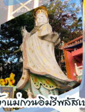
เจ้าแม่กวนอิมรัฟลัสเบง