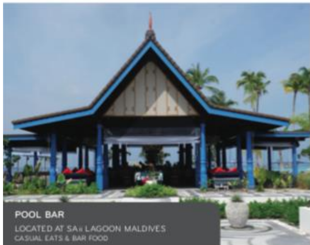
POOL BAR LOCATED AT SAJI LAGOON MALDIVES CASUAL EATS & BAR FOOD