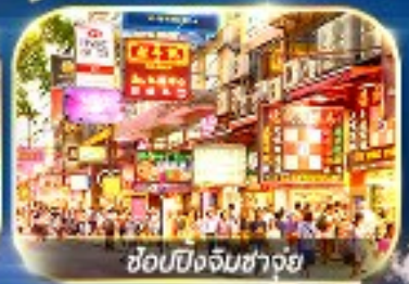
ซุปปิ้งจิมซ่างัย

เต็มอิ่มทั้ง ไหว้พระบอพร และ ซุปปิ้งแบบจัดเต็ม