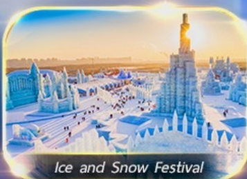
Ice and Snow Festival