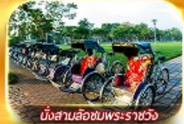
นั่งสามล้อชมพระราชวัง

สัมผัสความสวยงามหมู่บ้านสไตลฝรั่งเศสที่บานาฮิลล์ วัดเทียนมู่ พระราชวังเว้ สัมผัสเมืองโบราณฮอยอัน ล่องเรือกระดิง