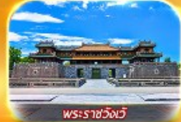
พระราชวังเว้