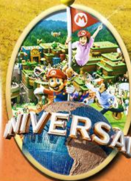
อิสระเลือกซื้อบัตร Universal Studios Japan