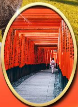
Fushimi Inari Shrine

รหัสทัวร์ RJ-XJ139 เดินทาง 5D 3N ก.ย. - ต.ค. 2569