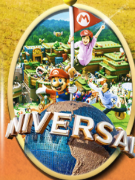
อิสระเลือกซื้อบัตร Universal Studios Japan