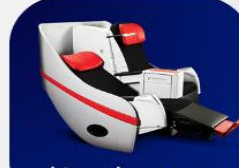
ที่นั่งพรีเมียมฟลัดเบด