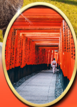
Fushimi Inari Shrine

รหัสทัวร์ RJ-XJ139 เดินทาง 5D 3N ก.ย. - ต.ค. 2569