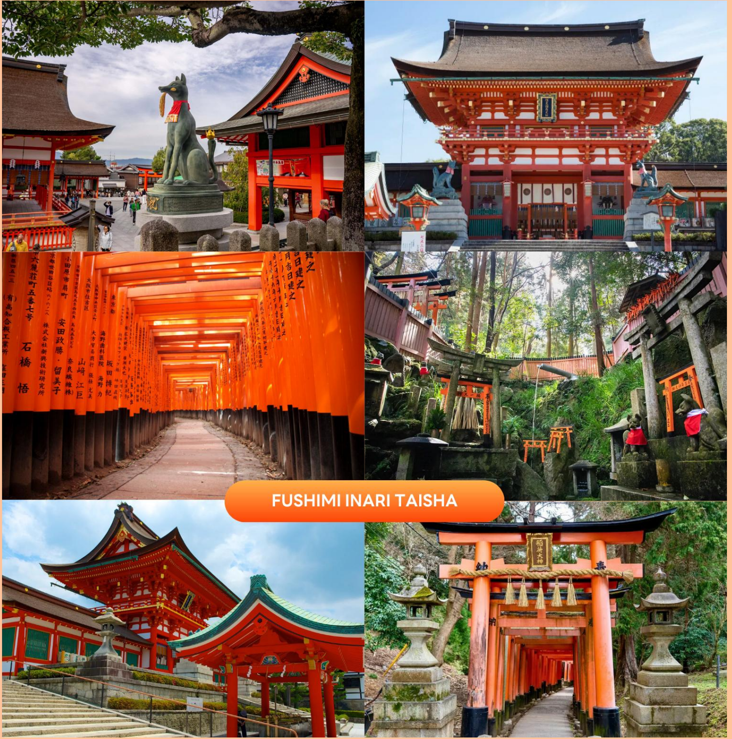
FUSHIMI INARI TAISHA

นำท่านสู่ ศาลเจ้าฟูชิมิอินาริ (Fushimi Inari Taisha) สร้างขึ้นเพื่ออุทิศแก่ อินาริ เทพเจ้าแห่งการเพาะปลูก และการค้า ที่รุ่งเรือง เป็นศาลเจ้าที่สำคัญที่สุดในบรรดาศาลเจ้าอินาริทั้งหมดในญี่ปุ่น แนวเสาประตูโทริอิสีส้มสดใสทอดยาวอย่างสุดตา ที่ทอดยาวขึ้นไปสู่ยอดเขาอินาริ ทำให้เกิดเป็นภาพอันน่าประทับใจ และเป็นหนึ่งในภาพที่โด่งดังของญี่ปุ่น ฟูชิมิอินาริโทยะนั้นเป็นทั้งศาลเจ้าของประชาชน และของราชสำนัก เป็นศาลที่พระจักรพรรดิหลายพระองค์มักแวะเวียนมาสักการะตั้งแต่ในอดีต ( การเปลี่ยนสีของใบไม้ ขึ้นอยู่กับสภาพอากาศเป็นสำคัญ )