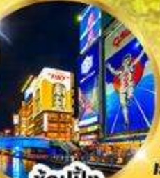
ช้อปปิ้ง ชินไซบาชิ