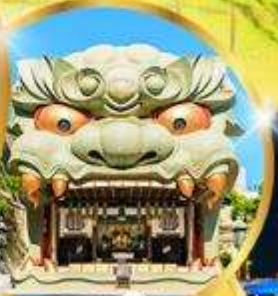
ศาลเจ้า นัมมะ ยาชากะ