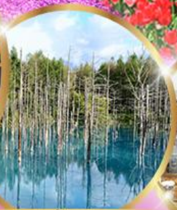
บ่อน้ำสีฟ้า