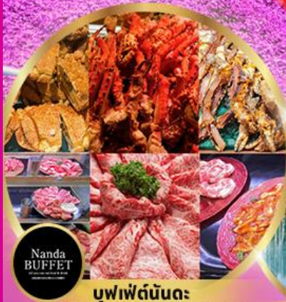
บุฟเฟ่ต์นันทะ