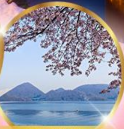
ทะเลสาบโทยะ