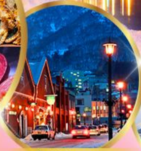
โอดังฮิรูแดง