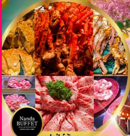
บุฟเฟ่ต์นันทะ ซาปู 3 ชนิด + ซีฟู้ด + วาทิวA5