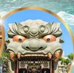
ศาลเจ้านิมะ ยาชากะ