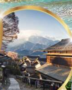
มาโกเมะจุกุ