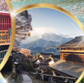
มาโกเมะจุกุ