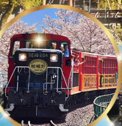
รถไฟสายโรแมนติก