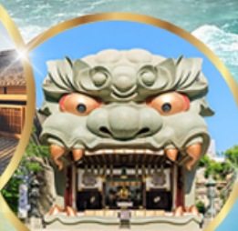
ศาลเจ้านิมะ ยาชากะ