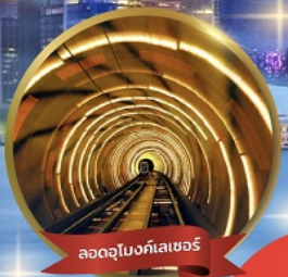
ลอดอุโมงค์เลเซอร์