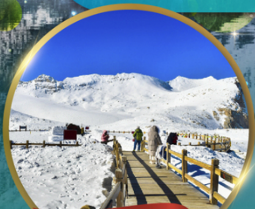
ต้าตุ่กลาเซียร์