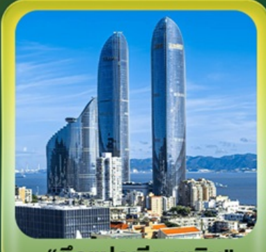
“ตึกแฝดเซี่ยเหมิน”