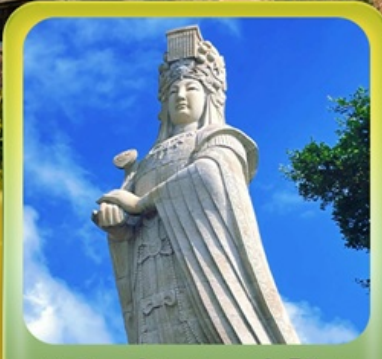
“เจ้าแม่กิมมัทมาโจ้ว”

เที่ยวเซี่ยเหมิน เมืองท่าชายฝั่งทะเล • บ้านดินตุ๋นไหลว • ชมการแสดงชาวฮักกา เมืองโบราณฉวนโจ้ว • วัดโคหยวน • เจ้าแม่กิมมัทมาโจ้ว • โซว์ตำนานแห่งฝูเจี้ยนใต้ เกาะกู่ลิ่งอวี • ถนนคนเดินหลงโกวหลู่ • วัดหนานฝูโต้ว • ย่านศิลปะซาโปหย่วย