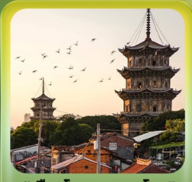
“เมืองโบราณฉวนโจ้ว”

เที่ยวเซี่ยเหมิน เมืองท่าชายฝั่งทะเล • บ้านดินตุ๋นไหลว • ชมการแสดงชาวฮักกา เมืองโบราณฉวนโจ้ว • วัดโคหยวน • เจ้าแม่กิมมัทมาโจ้ว • โซว์ตำนานแห่งฝูเจี้ยนใต้ เกาะกู่ลิ่งอวี • ถนนคนเดินหลงโกวหลู่ • วัดหนานฝูโต้ว • ย่านศิลปะซาโปหย่วย