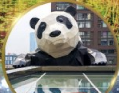
แพนด้ายักษ์

มหัศจรรย์ความงาม อุทยานจิวจ้ายโกว (รวมรถเหมาเที่ยวอุทยานเต็มวัน) ชมอุทยานหวงหลง (รวมกระเช้า) • สี่ดรุณี • อุทยานของเขี้ยวโกว (รวมรถอุทยาน) เมืองเก่าชงพาน • ถนนคนเดินจิมฮลี + ไถ่กู๋ฮลี • ชมแพนด้ายักษ์ป็นตึก