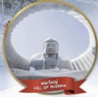
พระใหญ่ HILL OF BUDDHA