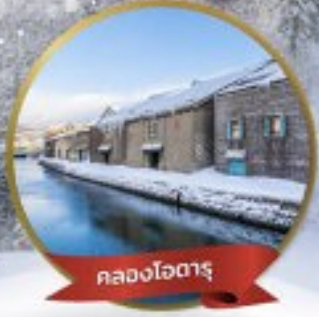
คลองโฮตารุ

13-19 ม.ค. 2568 20-26 ม.ค. 2568 27 ม.ค.- 2 ก.พ. 68