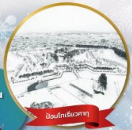
ป้อมโทริเยวคาคุ

หมู่บ้านนิงเกิลเกอเรส • สวนสัตว์อาซาฮิยาม่า • ชมขบวนพาเหรดเพนกวิน ตลาดเช้าฮาโกดาเตะ • ป้อมโทริเยวคาคุ • นั่งกระเช้าชมเมืองฮาโกดาเตะ ลานสกี • HILL OF BUDDHA • โฮตารุ • คลองโฮตารุ • หมู่บ้านรามเม