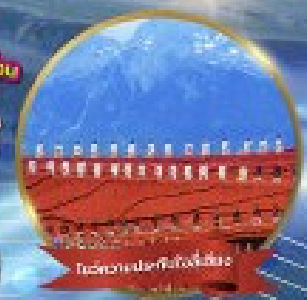
วัดลามะของจ้านหลิน