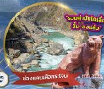
ช่องแคบเส็งกระเอน