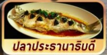
ปลาประจักษ์ริบตี