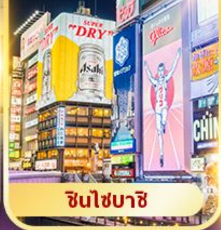
ชินไซบาชิ