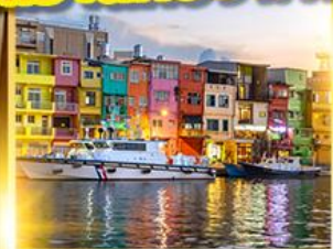
หมู่บ้านประมงเจิ้งปิน