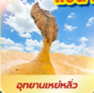
อุทยานเหย่หลิว