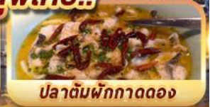
ปลาต้มพริกทอดดอง