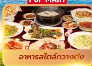
อาหารสตรีทกวางตุ้ง