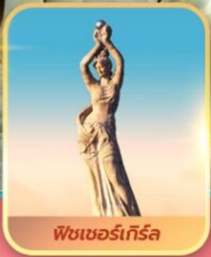
ฟิชเชอร์เทียร์ล