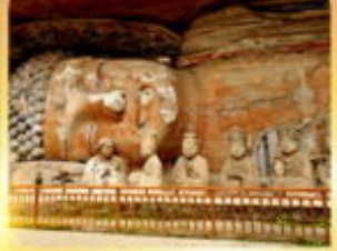
พระแกะสลักหินต้าจู๋