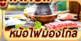
หม้อไฟมองโกล