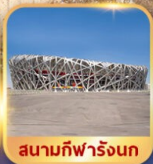
สนามกีฬารังนก