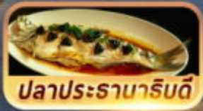
ปลาประดานารีบตี