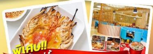
พิเศษ!! ก๊วยแม่น้ำ + HOTPOT SEAFOOD