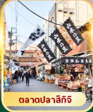
ตลาดปลาซึกิจิ