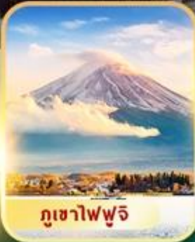
ภูเขาไฟฟูจิ