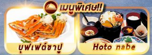
เมนูพิเศษ!!