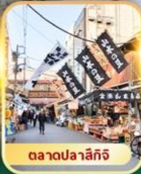
ตลาดปลาสึกิจิ