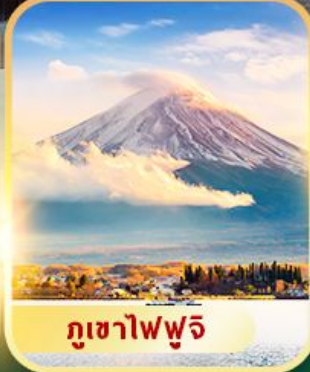
ภูเขาไฟฟูจิ