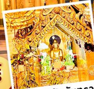
พระสุริยันจันทรา