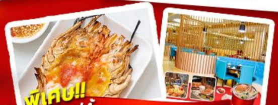
พิเศษ!! กึ่งแม่น้ำ + HOTPOT SEAFOOD