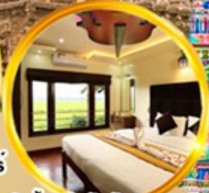
พักบ้านเรือสันทันวัฒนธรรมชาติ