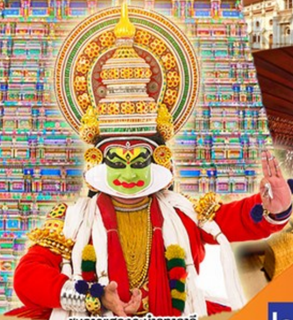
ชมการแสดงระบำคากากาลี