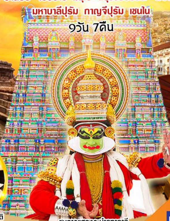
ชมการแสดงระบำคทากาลี