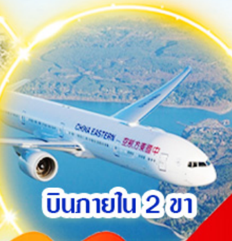
บินภายใน 2 ชม