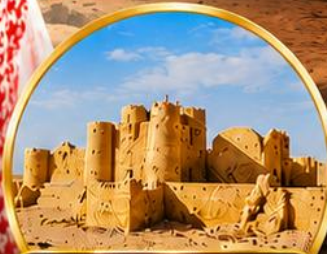
กลุ่มปราสาททะเลทราย (Desert Castles)