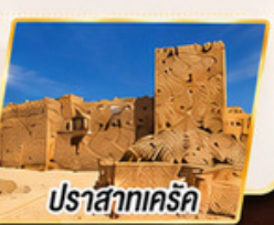
ปราสาทครัค