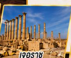
เจอร์ราช