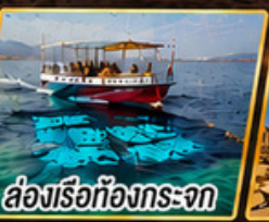
ล่องเรือท้องกระจก