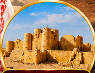
กลุ่มปราสาททะเลทราย (Desert Castles)