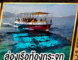
ล่องเรือท้องกระจก