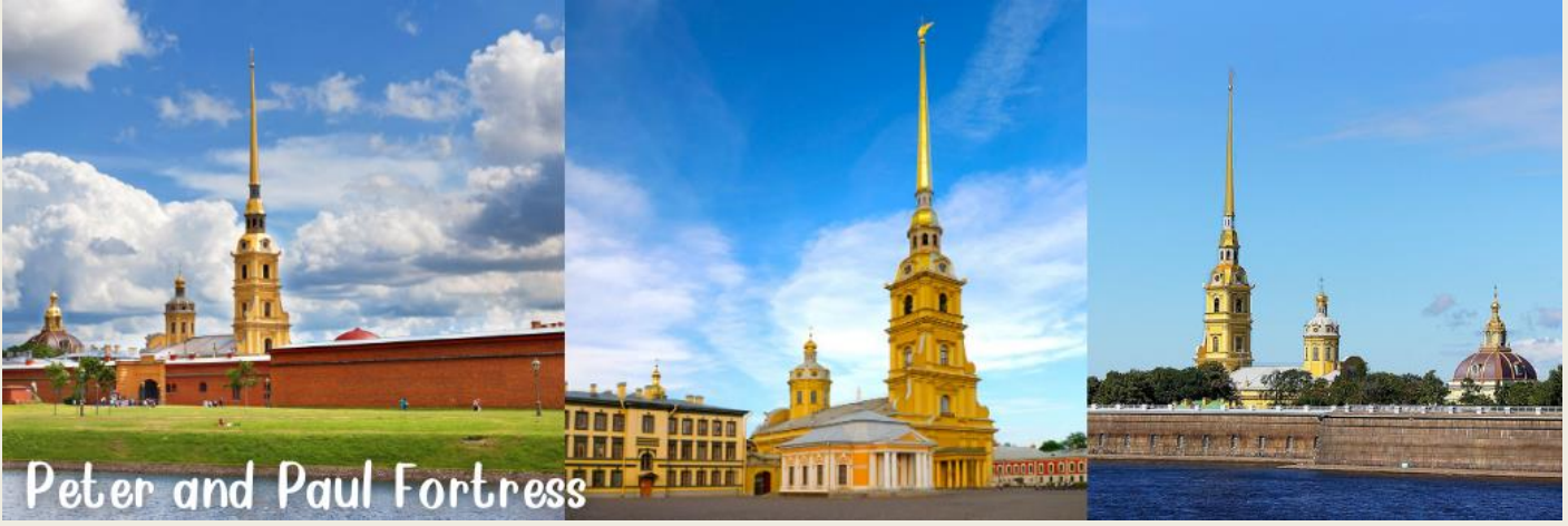
Peter and Paul Fortress

กลางวัน 📍 รับประทานอาหาร ณ ภัตตาคารท้องถิ่น นำท่านชม บ้อมปีเตอร์ แอนด์ ปอลด์ (Peter And Paul) เป็นสิ่งก่อสร้างแรกสุดของเมือง St Petersburg สร้างในปีค.ศ 1703 เป็นอนุสรณ์ชัยชนะสงครามเหนือสวีเดน ด้วยศิลปะแบบบารอกเพื่อใช้เป็นบ้อมปราการในการป้องกันข้าศึกกรุกราน ตั้งอยู่บน เกาะวาซิลเยฟสกี (Vasilievsky Island) ลักษณะเป็นรูปทรงหกเหลี่ยม กำแพงเป็นหินก่ออิฐ ส่วนวิหารปีเตอร์ แอนด์ ปอลด์ (Peter-and-Paul-Fortress) เริ่มสร้างขึ้นเมื่อปีค.ศ 1712 ด้วยการ ออกแบบของ DomennicaTrezzini สร้างเสร็จในวันที่ 29 มิถุนายน ค.ศ 1733 ตั้งชื่อวิหารแห่งนี้เพื่อเป็นเกียรติแด่นักบุญปีเตอร์ และนักบุญปอลด์เพื่อเป็นการเผยแพร่ศาสนา ความสูงของยอดแหลมคือ 122.5 เมตร ในอดีตเป็นสิ่ง ก่อสร้างที่สูงที่สุดของเมืองและห้ามสร้างสิ่งก่อสร้างใดสูงกว่า ภายในทำการตกแต่งด้วยศิลปะบารอกซึ่งนับว่าแตกต่าง กับโบสถ์คริสต์ออร์ทอดอกซ์ทั่วไปและวิหารแห่งนี้ยังเป็นที่เก็บพระศพของราชวงศ์โรมานอฟ เริ่มต้นจากพระเจ้าปีเตอร์มหาราชเป็นองค์แรก จนกระทั่งถึงกษัตริย์องค์สุดท้ายของราชวงศ์