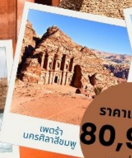
เพตรา บครศิลาสัมพู