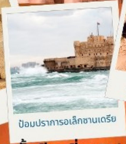
ป้อมปราการอเล็กซานเดรีย