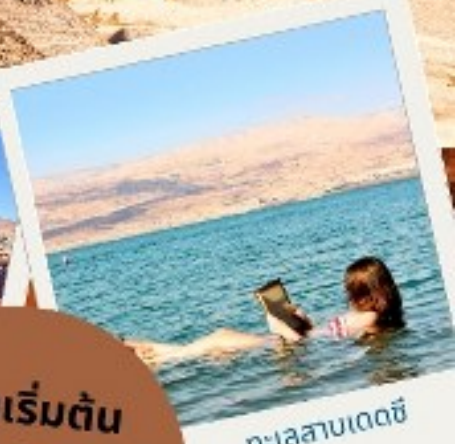
ทะเลสาบเดดซี