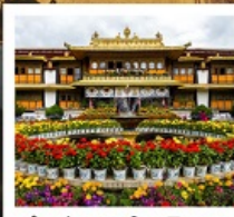
ตำหนักนอร์บูหลินมา

ชมวิวยอดเขานานเจียปาหว่า / จุดชมวิวกะเลปาหลูกลาง / อุทยานเขาเป็นยี่ / ระเบียบกระจก / วัดลามะ พระราชวังโปตาลา / วัดโจคัง / ถนนเปดหลียม / ทะเลสาบน้ำมูเซว / ตำหนักนอร์บูหลินมา / เมืองโบราณลั่วใต้