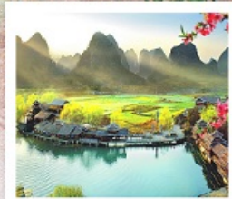
เมืองลิบไถ่