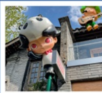
ถนนคนเดินซอยกว้างแค้น