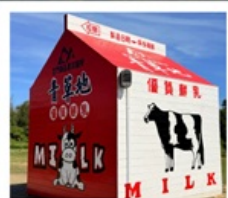
ฟาร์มโคนมจินเหมิน